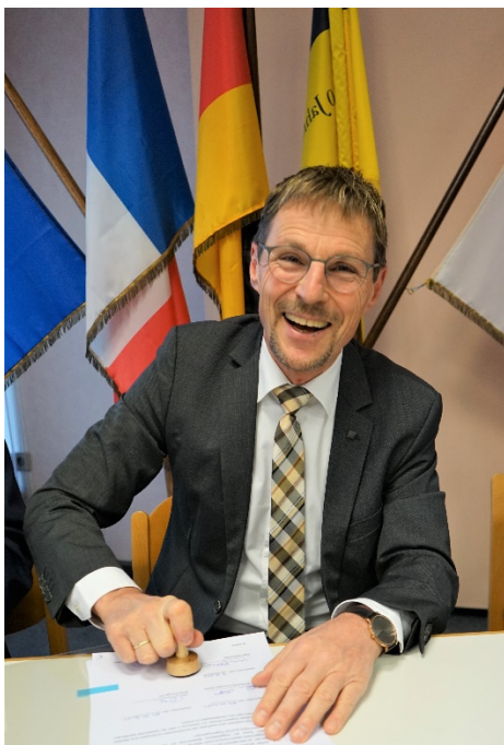
Bürgermeister Jürgen Galm, Osterburken